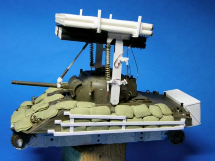
Vista laterale del mezzo che mette in evidenza la gabbia di ritegno per le protezioni aggiuntive (sacchetti di sabbia riprodotti in Milliput)

Conversione autocostruita in scala 1/48 su base commerciale Tamiya