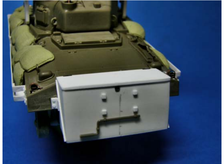
Cassetta porta razzi posteriore riprodotta in plasticard e dettagliata con fotoincisioni di recupero per le mappe.