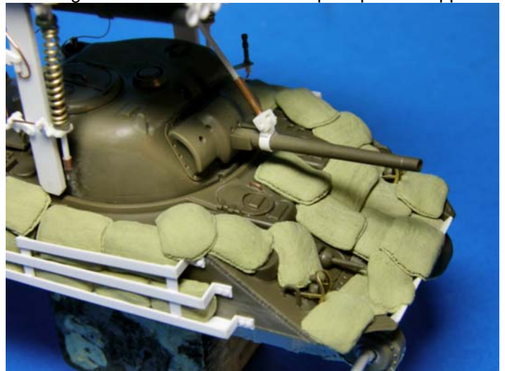
Vista della parte frontale dello scafo, ricoperta anch'essa con sacchetti di sabbia riprodotti in Milliput